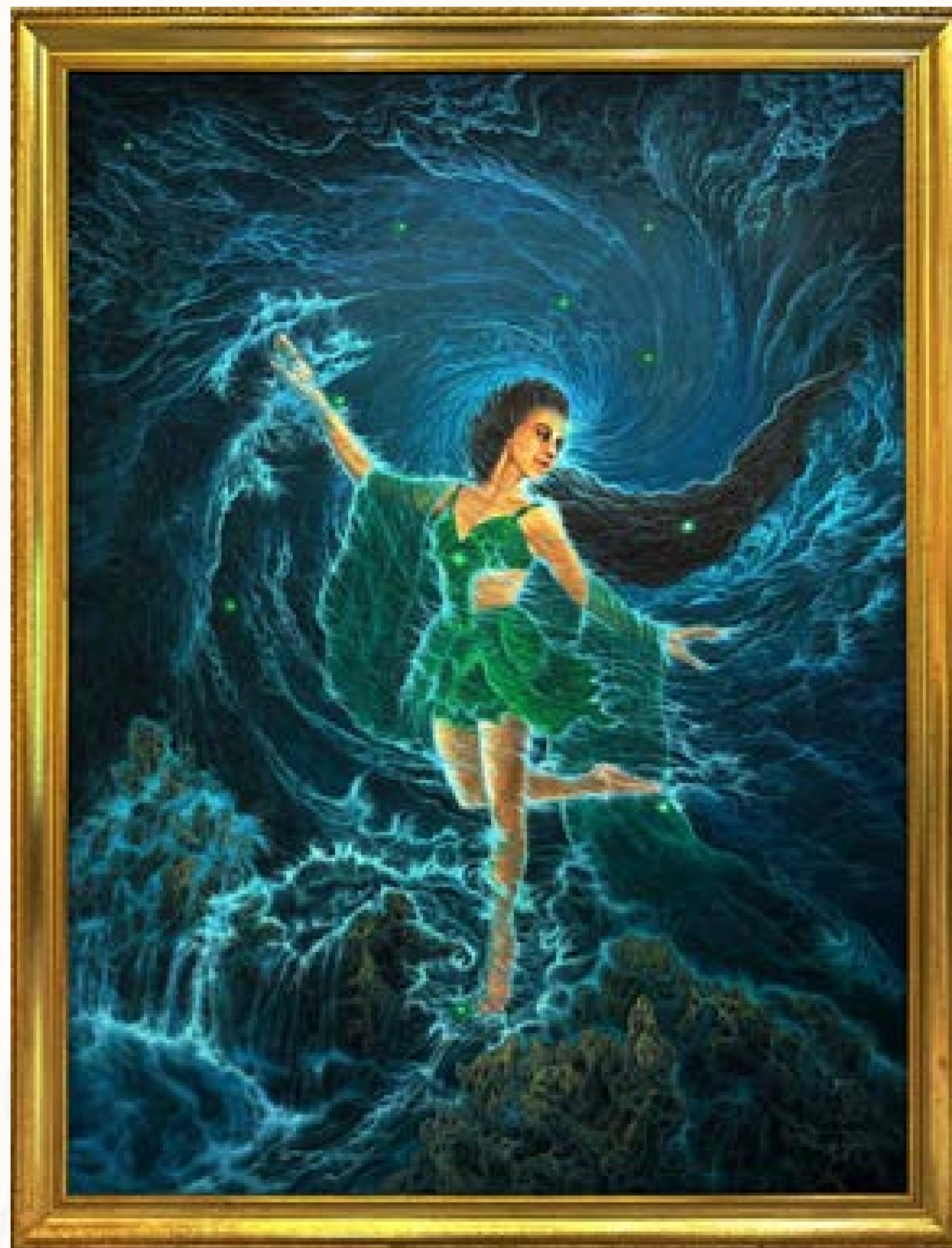
Padma Hati Laut Selatan 200 x 150 cm, Oil on Canvas