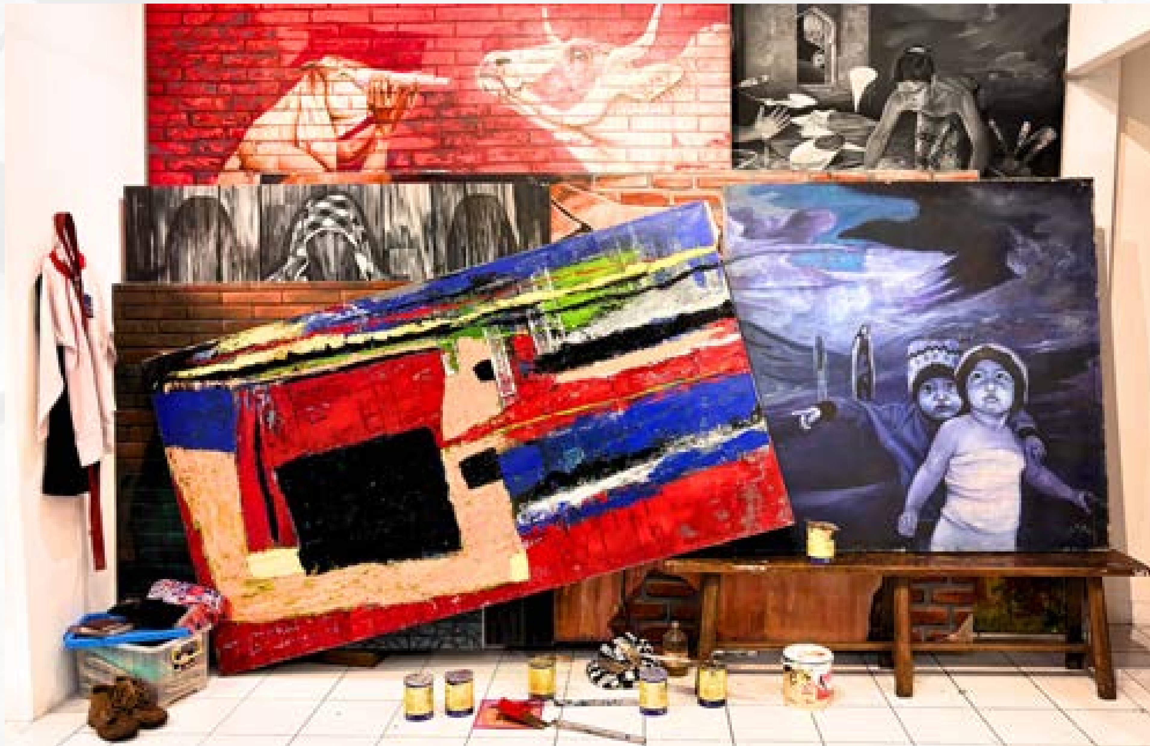
Studio Lukis Zaenal Arifin