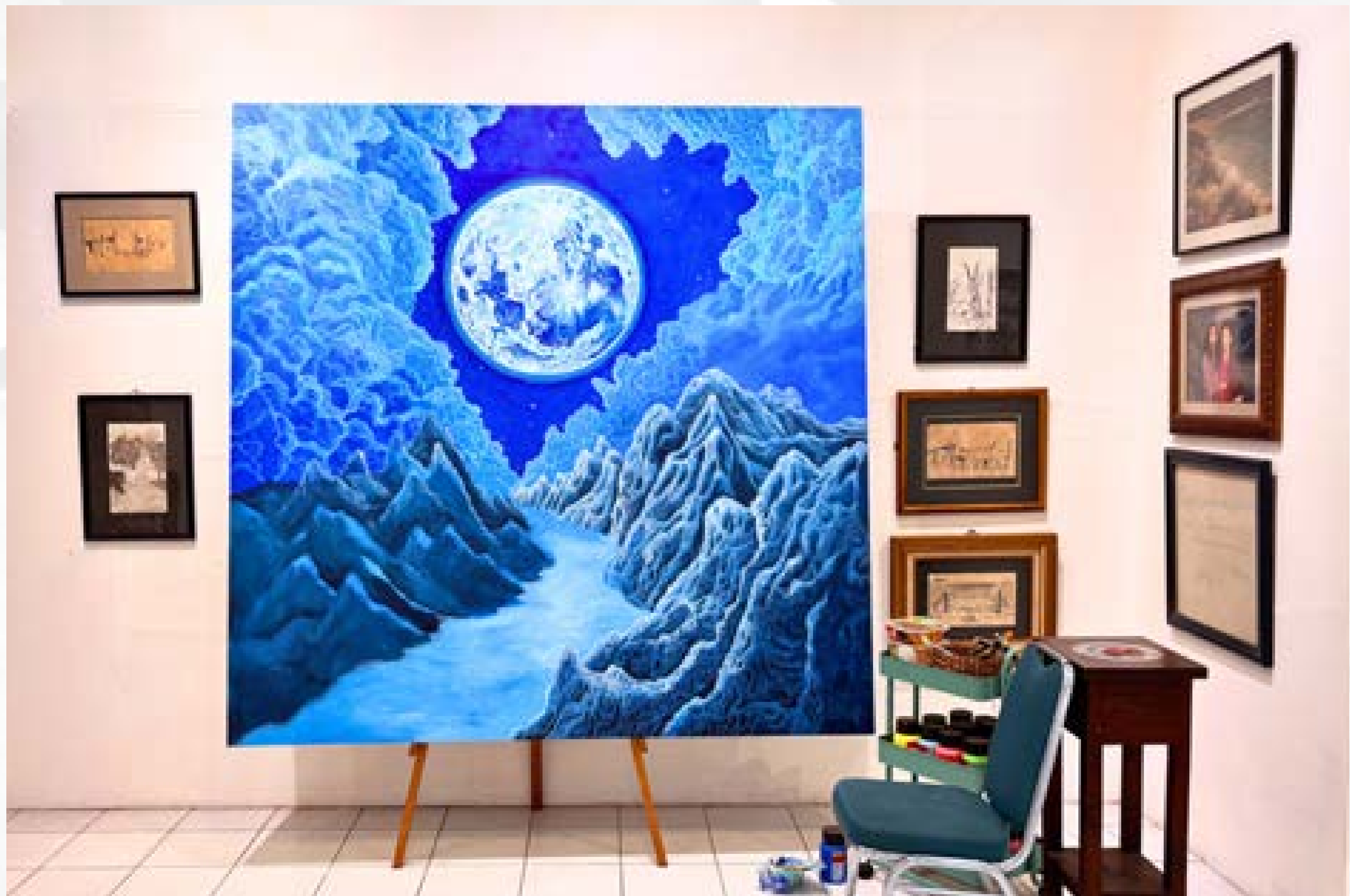
Studio Lukis Lucia Hartini