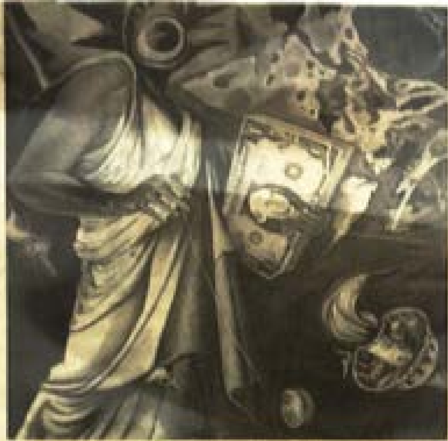
"Power Syndrome" karya Zaenal Arifin