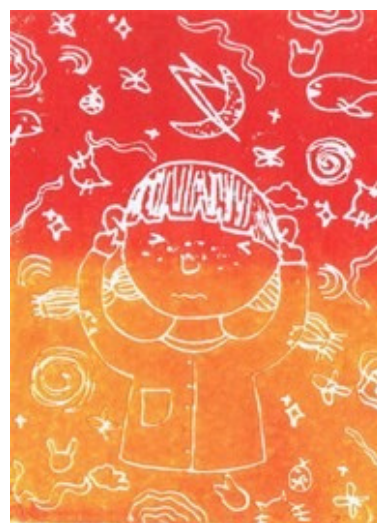
DOVA FEBRIYANTI (TINDES ART & FRIENDS)

SEMAKIN TINGGI (1/1) 19 X 15,5 CM RELIEF PRINT PADA KERTAS TINTA CETAK BASIS MINYAK 2025