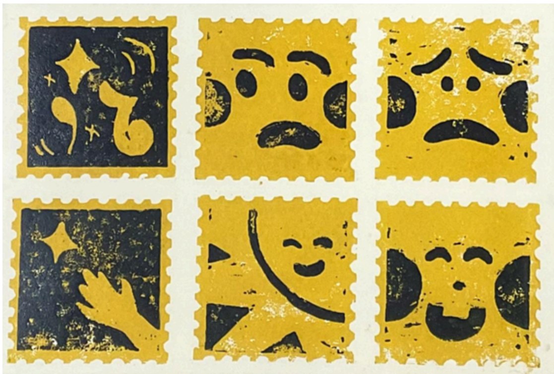
ANNISA DELA WIDHIASTUTI JELANG MENJELANG SINAR (4/4) 17 X 26 CM (@ 8 X 8 CM) RELIEF PRINT PADA KERTAS ASTER TINTA CETAK BASIS MINYAK 2024

Tujuan festival ini untuk mensyukuri kebersamaan, baik di ruang seni tides art, di masyarakat, di ruang seni galeri. Tujuan tersebut menjadi istimewa dengan kehadiran Pra Diskomfest ke-9 DKV ISI Yogyakarta,