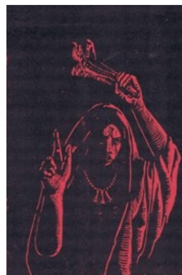
BARUNATA THE OATH OF QAYIN (4/5) 20 X 30 CM RELIEF PRINT PADA KERTAS TINTA CETAK BASIS MINYAK 2024

MEMBURU SENYAP (2/2) 20 X 15 CM RELIEF PRINT PADA KERTAS ASTER TINTA CETAK BASIS MINYAK 2024